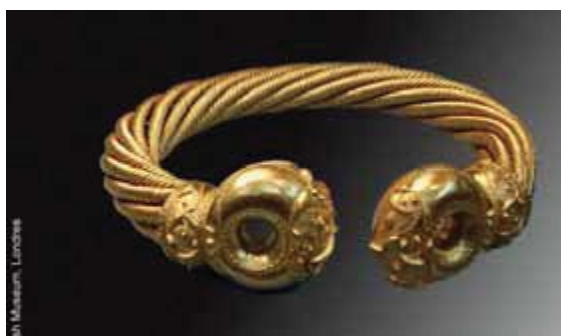
Bijou de l'âge de fer

partagent leurs savoirs et savoir-faire. C'est ainsi que j'ai construit mon premier récepteur Météosat équipé de sa parabole en fibre de verre dans les années 1980, le tout de fabrication maison.